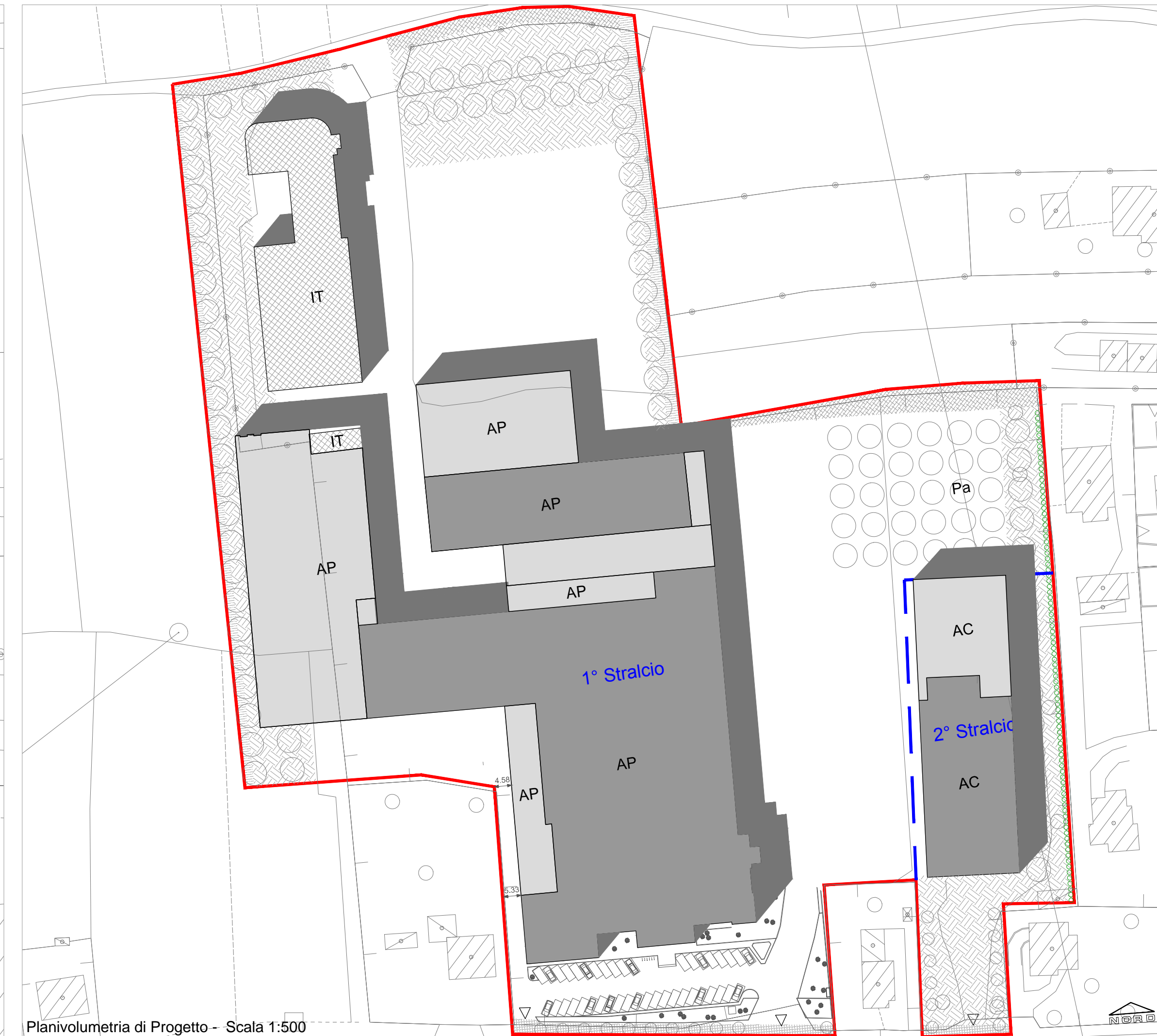
Planivolumetria di Progetto - Scala 1:500