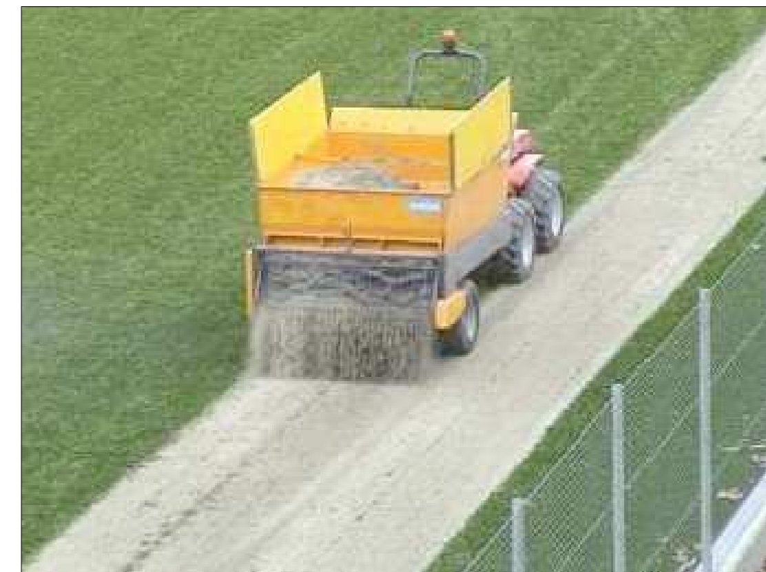
INTASAMENTO DI STABILIZZAZIONE ESEGUITO CON SABBIA SILICEA