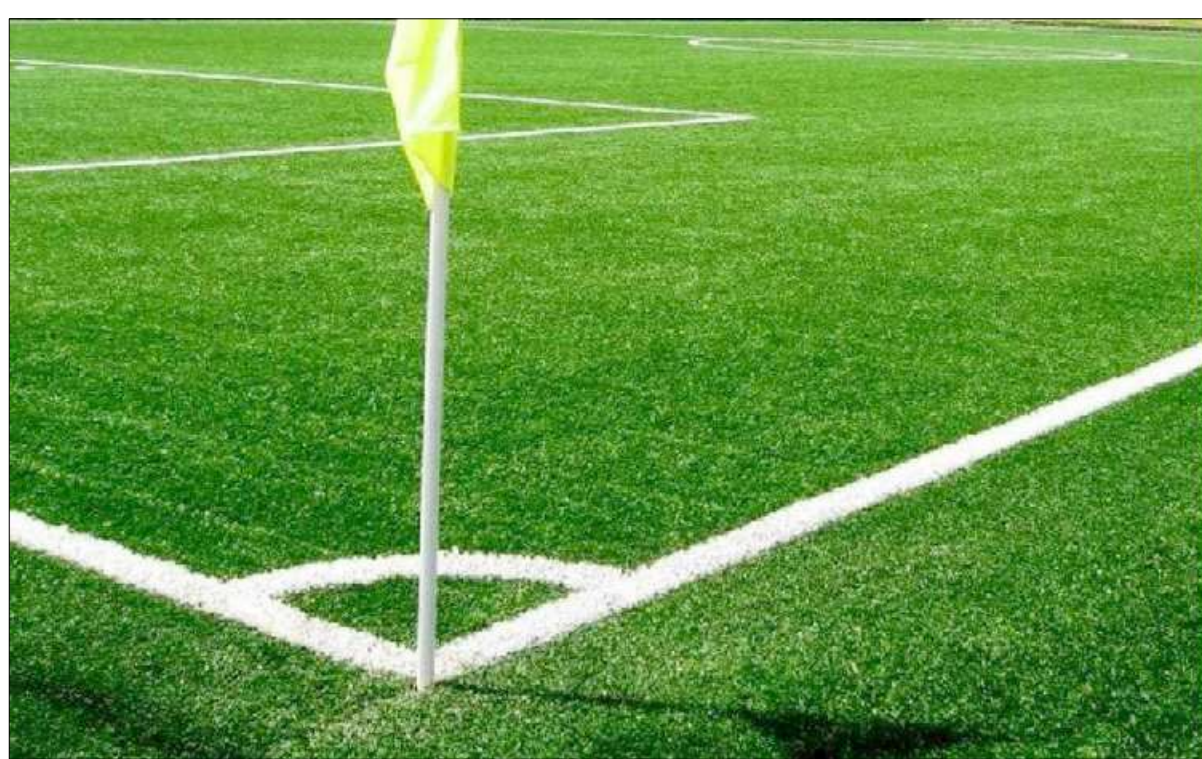
PARTICOLARE NUOVO CAMPO DA GIOCO IN ERBA SINTETICA