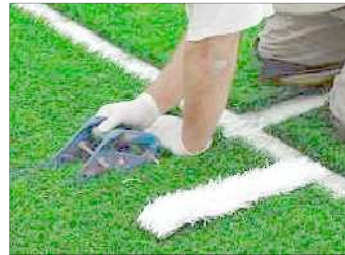
SEGNATURA ESEGUITA AD INTARSIO